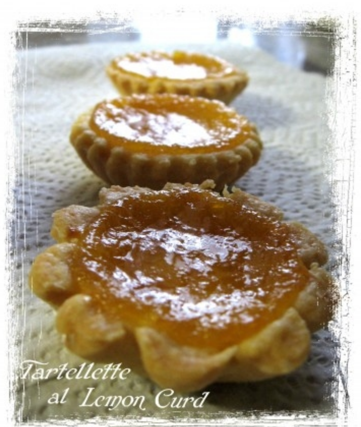
Tartellette al Lemon Curd

Stendete la pasta e rivestite le formine per le tartellette (o quello che avete a disposizione) riempiate con il lemon curd (non troppo se no durante la cottura fuoriesce) infornate a 180° per 10 minuti, poco prima della fine, cospargetele con un cucchiaino di zucchero di canna, rimettete in forno e accendete il grill per qualche minuto fino a caramellare.